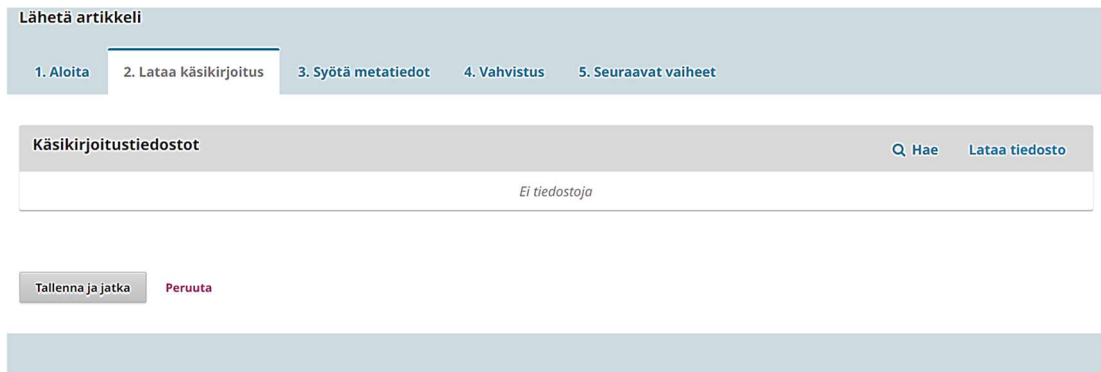
KUVA 2. Käsikirjoitustiedoston lataaminen

Käsikirjoituksista kirjoittajat lähettävät vain anonymisoidun version, johon on sisällytetty otsikoidut taulukot ja kuvat sekä liitteet ja abstraktit sekä asiasanat (suomi + englanti) . Sen sijaan kuvien paikat ja otsikot merkitään käsikirjoitukseen, mutta lähetetään erillisinä tiedostoina (jpg tai png). Erillistä kansilehteä ei tarvitse laittaa, sillä nämä tiedot syötetään alustaan seuraavassa vaiheessa (ks. Kuva 3). Käsikirjoituksen tiedostot syötetään Lataa tiedosto -kohdasta. Tiedoston lisäämisen jälkeen tulee painaa Suorita ja lopuksi Tallenna ja jatka. Tiedostot ladataan alustaan yksi kerrallaan, jolloin joka vaihe on tallennettava ennen jatkamista. Mikäli käsikirjoituksessa ei ole kuvia, ladattavia tiedostoja on vain yksi.