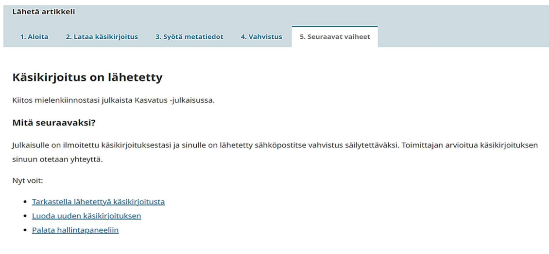
KUVA 5. Loppuviesti

Viimeisessä vaiheessa alusta kuittaa käsikirjoituksen lähettämisen prosessin loppuunviedyksi (ks. Kuva 5), minkä jälkeen kirjoittajien on mahdollista vielä tarkastella käsikirjoitustaan ja myöhemmin seurata sen vaiheita sekä ottaa käsikirjoitukseen liittyvissä asioissa yhteyttä toimitukseen.