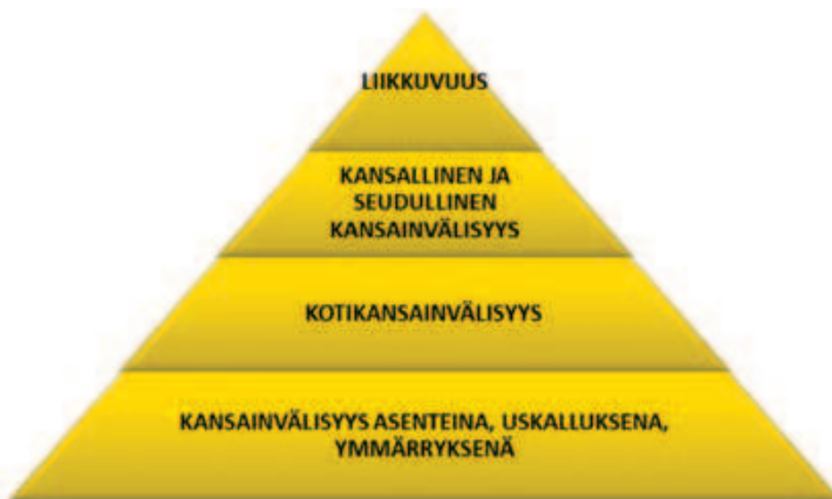
Kuvio 1. Koulujen kansainvälisyyden toimintamuodot (Mattila 2012)

Mattila (2012) on käsitteellistänyt koulujen kansainvälistymistä pyramidin avulla (ks. kuvio 1).